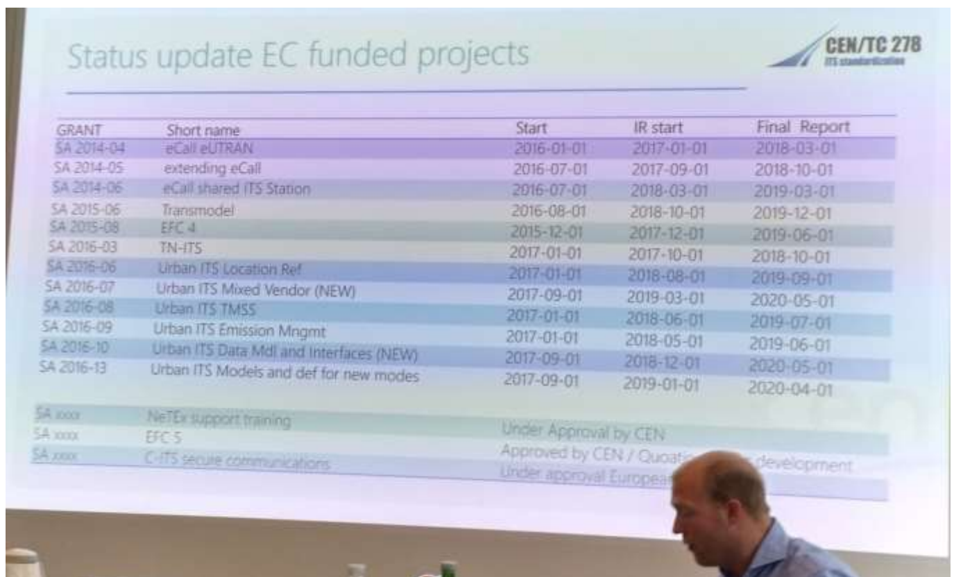
Obrázek 2 Přehled standardizačních projektů financovaných Komisí (obrázek z minulého zasedání)

MP představil status financovaných akcí z EC, viz následující obrázek, od minula žádná změna. Práce některých projektových týmů teprve začíná. Více o práci konkrétních týmů je v samostatné kapitole.