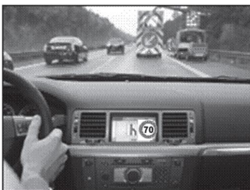
Obrázek 1 – Příklad zobrazení dynamických zpráv ve vozidle (obr. 1 normy)

Tato technická specifikace definuje službu pro posílání a zobrazování informací a dopravního značení z pozemní komunikace do vozidla, a také způsob zobrazení dopravních informací a dopravního značení ve vozidle s ohledem na jeho vnímání řidičem. Dále technická specifikace řeší, jaké informace a s jakou validitou jsou posílány z dopravní infrastruktury do vozidla. Příkladem jsou rychlostní značky, dopravní informace, a zejména pak dynamické zprávy a informace z proměnného dopravního značení a ze zařízení pro provozní informace. Nedílnou součástí technického popisu je i představení vlastní architektury, komunikační protokol a sady požadavků na vhodné úroveň vysílacího výkonu, šifrování komunikace mezi stanicí instalovanou na infrastruktuře, např. dopravní značkou a vozidlem (posílání symbolů dopravních značek či informací), včetně odpovědností operátora za nastavení správné informace pro přenos.