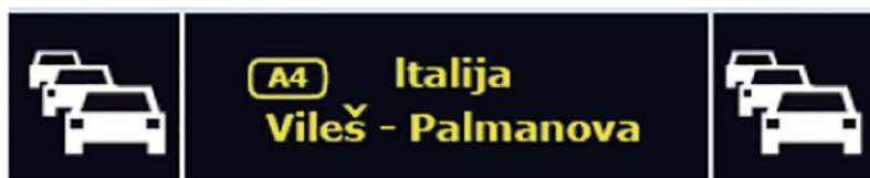
Obrázek 4 – Příklad textu VMS s jedním piktogramem na každé straně