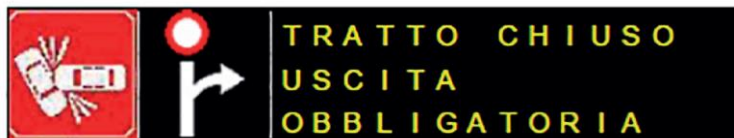
Obrázek 3 – Příklad textu VMS se dvěma piktogramy vlevo

Tato příloha uvádí příklady informativních a konstrukčních prvků proměnného dopravního značení. Vzhledem k tomu, že rozvržení značení není normativně stanoveno a je řešeno v závislosti na místních potřebách, mohou správci silničních sítí používat vlastní design. Příklad je na obrázku č. 3 a 4.