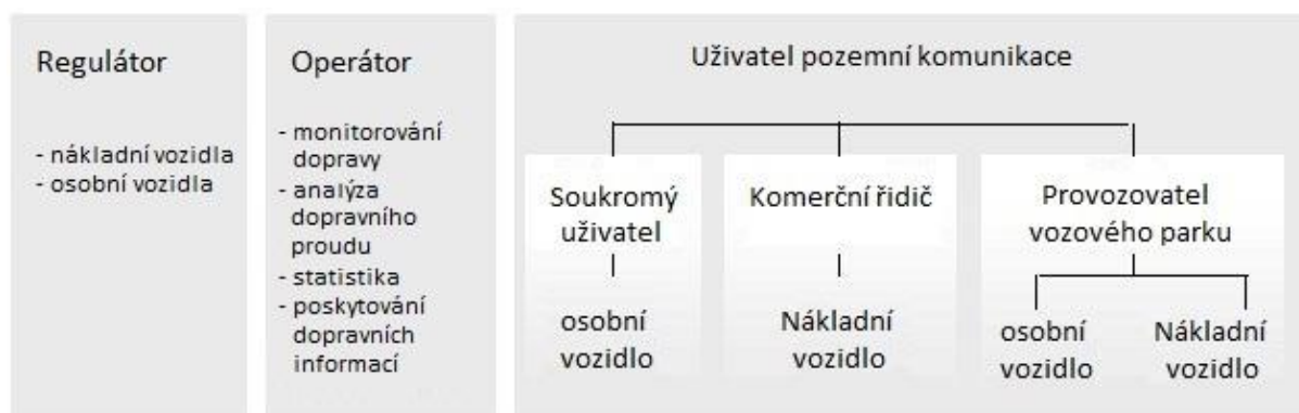
Obrázek 1 – Klasifikace ITS aplikací sídlících v OBE podle typu uživatele (Obr. 2 normy)

Analýza základních EFC norem ISO a CEN ukazuje, že EFC normy mají potenciál být užitečnými platformami pro definování VAS služeb, ale žádný výslovný odkaz na VAS v současné době neexistuje.