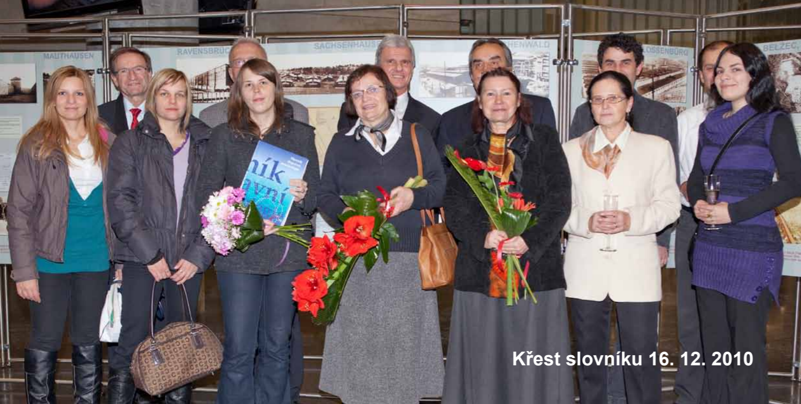
Křest slovníku 16. 12. 2010